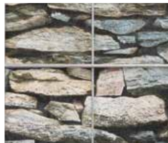
Motiv Stein Mediteran