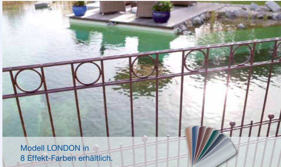
Modell LONDON in 8 Effekt-Farben erhältlich.